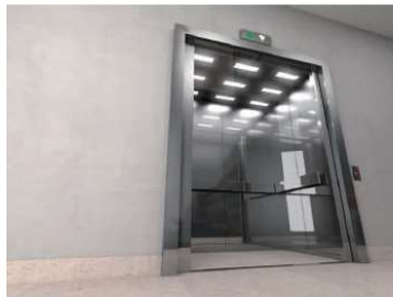
电子控制复杂的电梯