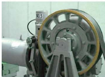
用于电梯电源电路的电能质量测量