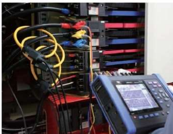
和电能质量分析仪组合使用